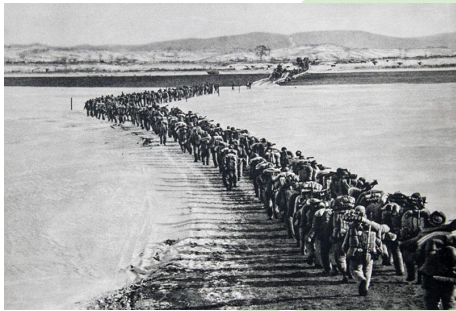
中国人民志愿军跨过鸭绿江

1950年9月30日，周恩来代表我国政府庄严宣告：“中国人民热爱和平，但是为了保卫和平，从不也永不害怕反抗侵略战争。中国人民决不能容忍外国的侵略，也不能听任帝国主义者对自己的邻人肆行侵略而置之不理。”10月8日，毛泽东发布命令，将东北边防军改为中国人民志愿军，迅即向朝鲜境内出动，协同朝鲜同志向侵略者作战并争取光荣的胜利。