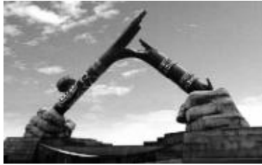
虎门海滩折断的烟枪