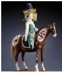
①唐戴帷帽女子骑马雕塑

康熙二十三年（1684年），清政府 在台湾设置一府（台湾府）、三县（台 湾、凤山、诸罗）的行政机构，并设 巡道一员，隶福建省。