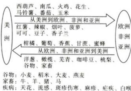
图1 1500年后世界物种交换示意图